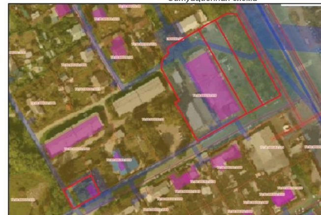
Экспликация образуемых земельных участков